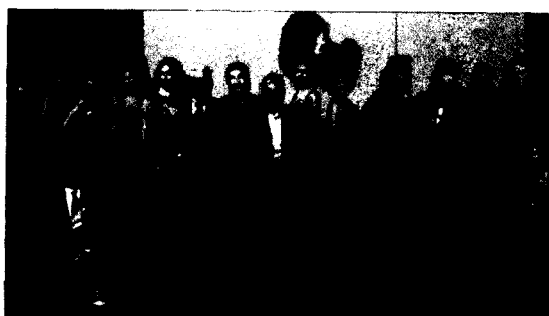
Il 16 ottobre Marinor ha festeggiato i quarant'anni di attività al Grand Hotel Villa Torretta di Sesto San Giovanni.