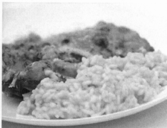
'Ossobuco day' ovvero la Giornata Internazionale delle Cucine Italiane

milano > bere & mangiare > Notizie ed eventi