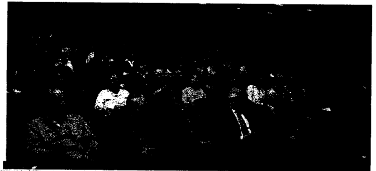
L'auditorium di Villa Torretta svernito.