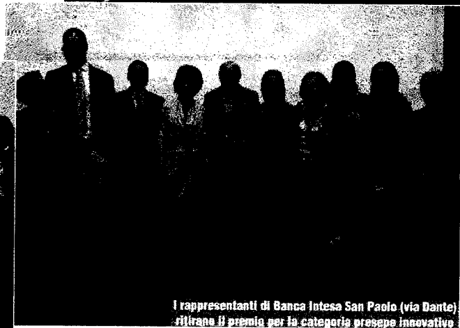
I rappresentanti di Banca Intesa San Paolo (via Dante) ritirano il premio per la categoria presenze innovative